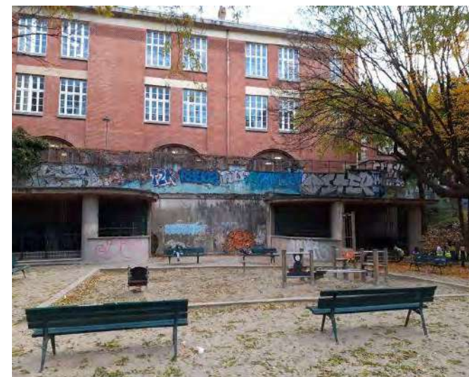
Stockage et manutention