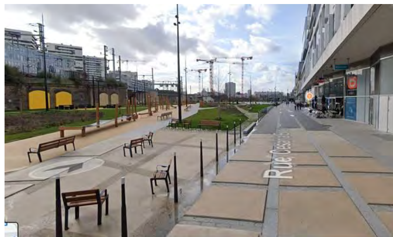
Proximité « voie pompier »