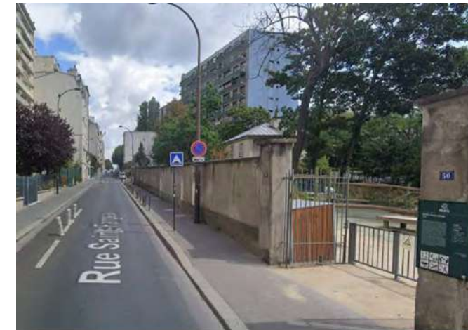
Visibilité et proximité route