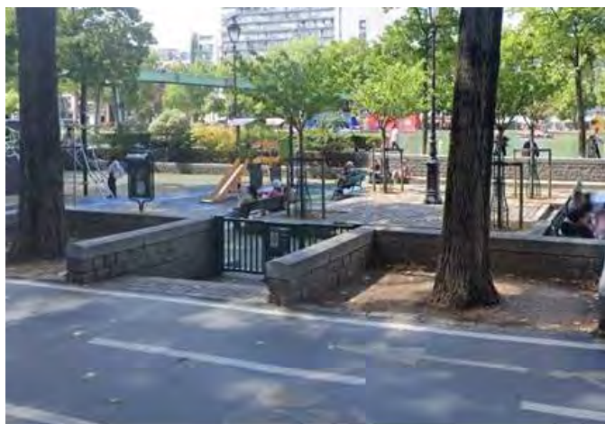
Accès sur piste cyclable