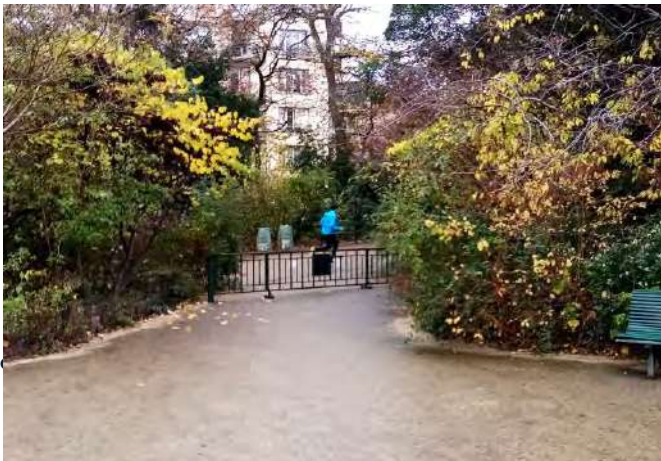
Visibilité et sens ouverture des portillons