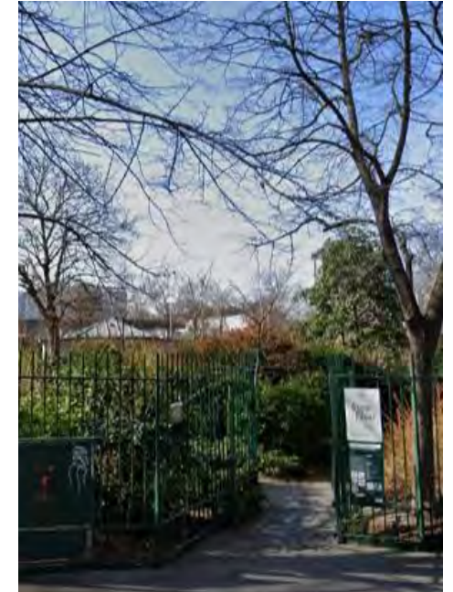
Entrée sans portillons